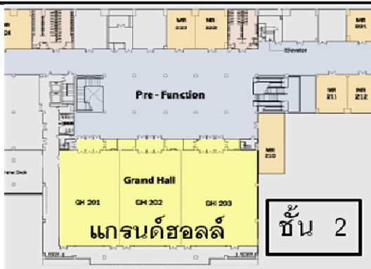
ที่เปิดงานสัปดาห์ฯ และห้องสัมมนาวิชาการ แกรนด์ ฮอลล์ ชั้น 2